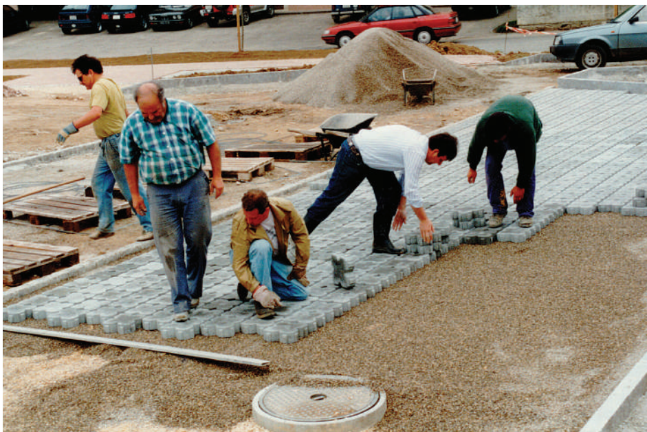
Le Conseil communal en action sur le terrain.

décide de réaliser sur ce site un magnifique parc public équipé de bancs, d'allées piétonnes, de jeux pour les activités ludiques, de parkings de chaque côté et à l'extrémité « Ouest » du bâtiment de la nouvelle Poste.