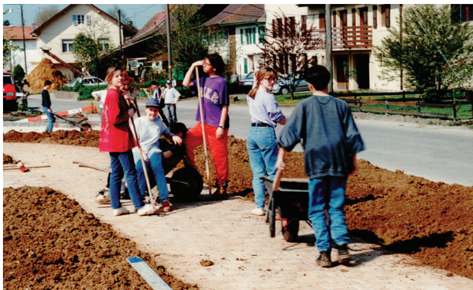
Les jeunes du village avaient contribué à la réalisation des travaux. Photo: Fondation du patrimoine culturel et religieux d'Alle

Fondation du patrimoine culturel et religieux d'Alle