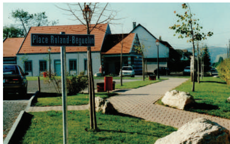
Un ouvrage apprécié par toute la population depuis 1994.