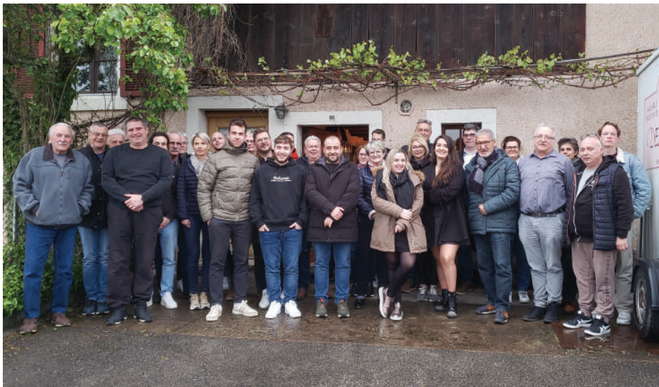
Les membres du Cartel des sociétés locales et les participants de la fête d'Alle 2024.

Dans le cahier des protocoles de l'époque, il n'est pas fait mention de la société «Sainte-Cécile» qui intégrera le «Cartel» plus tard. Les bases sont jetées. Le «Cartel» est né.