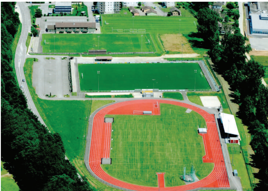
Photo aérienne du Centre sportif à son inauguration.

Une publication - privée - actuellement en élaboration fera état dans le détail du processus et des paramètres de ce projet qui aura nécessité 15 années d'efforts. (1989-2004)