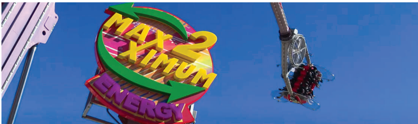
Le manège Maximum 2 des forains Jolliet sera à la fête d'Alle 2024.