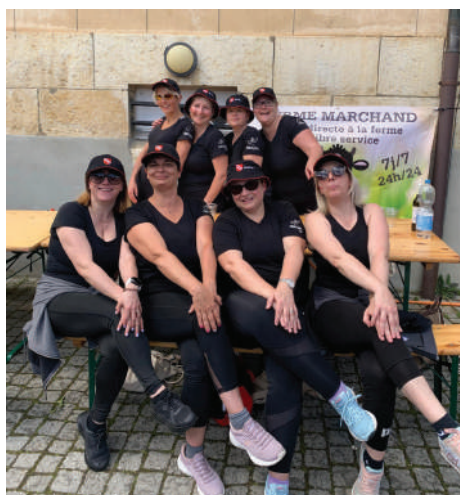
Toujours active, la Femina Sport a participé à la journée Fit&Fun.

La Femina Sport Alle a participé à la journée Fit&Fun le 25 mai 2024 à Courtedoux organisée par l'Association cantonale jurassienne de gymnastique (ACJG).