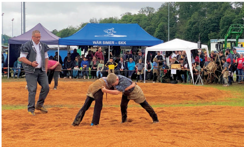
Les jeunes lutteurs ont foulé la sciure durant tout le dimanche.