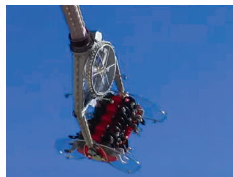
Aurez-vous le courage de monter sur le Maxxim 2 ?